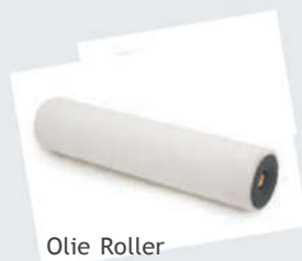
Olie Roller in 25 cm.