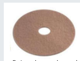
Beige vloerpad voor het