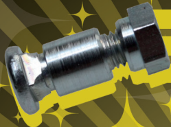
Reserve boutje + schroefje