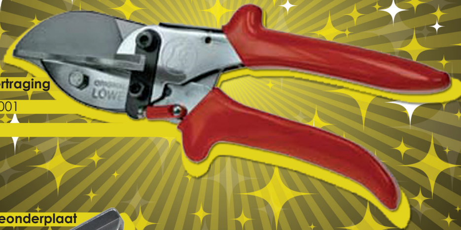
Verstekschaar met vertraging